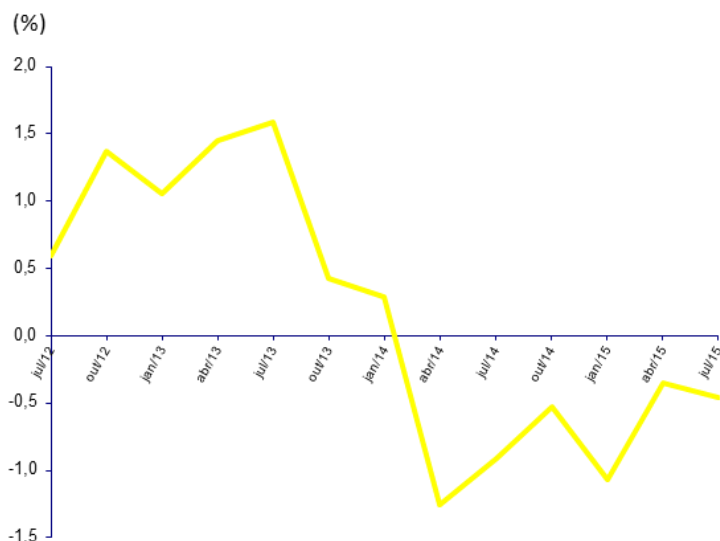
Gráfico 1 - Variações homólogas da taxa de salário mensal

A análise do gráfico 1 revela, desde abril de 2014, variações homólogas negativas da taxa de salário mensal para o conjunto das profissões abrangidas no Inquérito em referência.